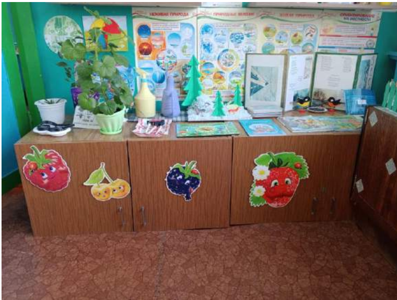
Уголок «Как, зачем и почему?»